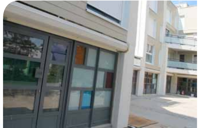
De nouveaux locaux dédiés à l'accompagnement scolaire.

C omme chaque année, toutes les écoles ont bénéficié des meilleurs soins durant la période estivale pour assurer un bon accueil et une bonne année scolaire aux élèves et aux enseignants. Des travaux, notamment de peinture, de création de salles, de réfection de sol, d'électricité, de plomberie ou de marquage dans les cours, ont été effectués. De nouvelles classes et salles ont été créées et réaménagées au groupe scolaire Cocteau dont un ancien logement de fonction a été rénové pour accueillir le Réseau d'aides spécialisées aux élèves en difficulté (Rased).