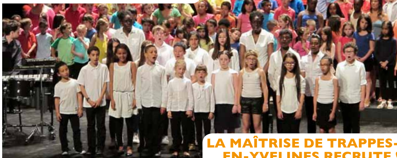
Sur la scène du Théâtre de Saint-Quentin-en-Yvelines.

LA MAÎTRISE DE TRAPPES-EN-YVELINES RECRUTE !