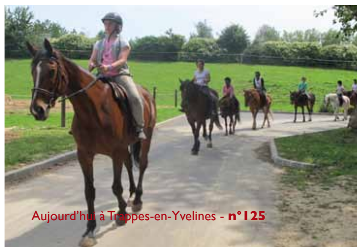
Aujourd'hui à Trappes-en-Yvelines - n° 125

À cheval, en canoë, en VTT ou à pied, les activités pour les jeunes ont été ludiques, sportives, culturelles ou de loisirs. Certains en ont profité pour passer leur code de la route après une formation accélérée. Fin août, les plus studieux s'étaient donnés rendez-vous dans le Jura pour des animations liées au programme scolaire.