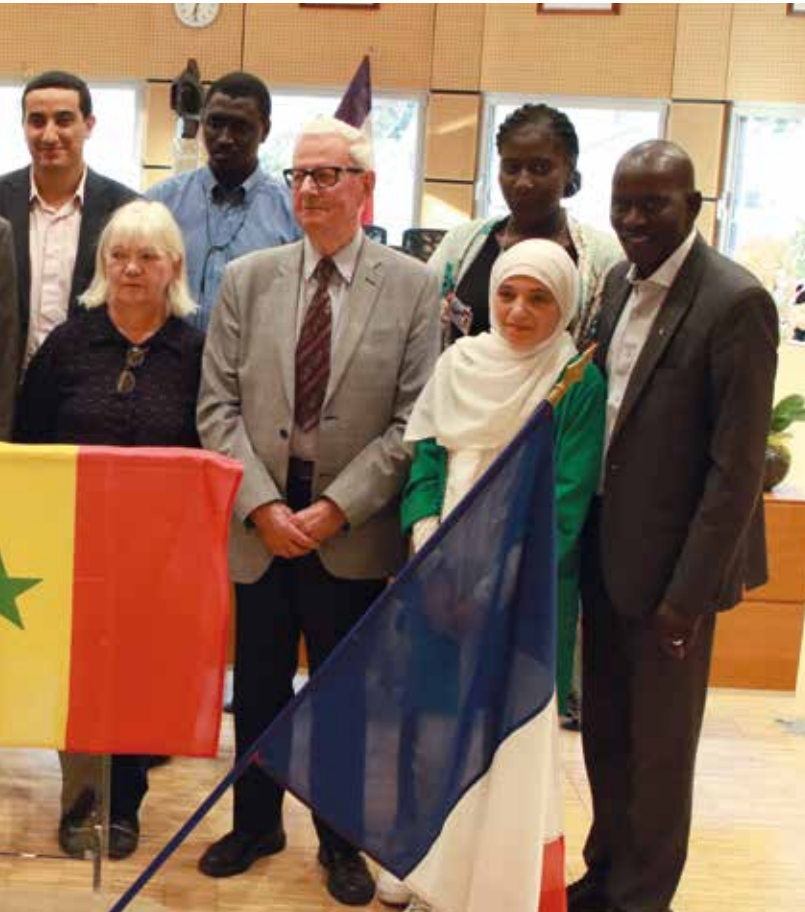
L'association des Ressortissants de Niery, le Comité de Jumelage et la Ville réunis pour la signature de la convention le 18 septembre en l'Hôtel de ville..

Un grand « Showroom des démarches en ligne » aura lieu le 23 novembre, de 9h30 à 13h, avec des ateliers interactifs pour découvrir l'e-administration. Profitez de la présence des partenaires (Pôle Emploi, CPAM et CAF des Yvelines...) et créez votre Compte Personnel d'Activités (ou PCF) ! Prenez les documents nécessaires (n° de sécurité sociale, n° d'allocataire CAF, n° fiscal, etc). Réservation : 01 34 82 82 61. Cite des métiers de Saint-Quentin-en-Yvelines, Zone d'activité du Buisson de la Coudre, 1 rue des Hêtres à Trappes. www.citedesmetiers.sqy.fr